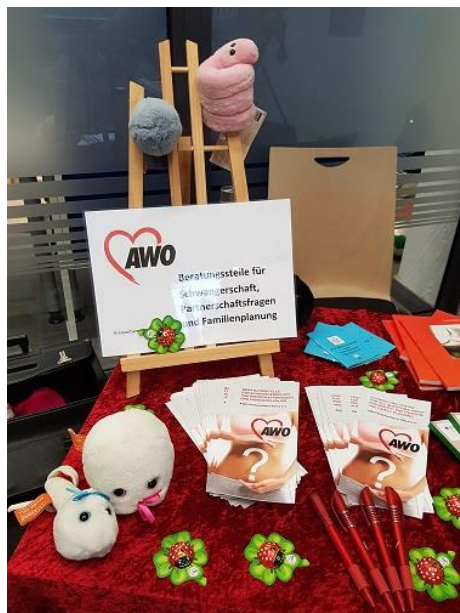
Teilnahme Fachtag Frühe Hilfen Kleve